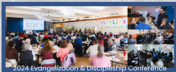
2024 Evangelization & Discipleship Conference

3 Our Lady of Guadalupe Celebration Diocesan event Sun., 10 AM - 3 PM St. Augustine Catholic High School